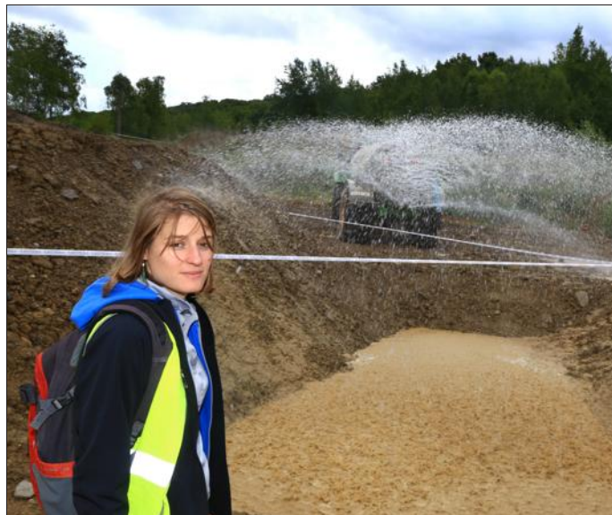
Mise en boue des Mud Moutains... Avec 11 000 litres d'eau.

Demain, ils seront près de 6 500 à prendre le départ de la 4 e édition du Mud Day, à Amnéville. Dès novembre 2016, les dossiers techniques avaient été préparés et les autorisations demandées auprès des villes impliquées. Le parcours a été reconnu en janvier. Depuis vendredi dernier, une équipe d'une trentaine de personnes s'affaire dans le bois de Coulange, à côté du Snowhall. Après le débroussaillage, le balisage et le terrassement, place au montage