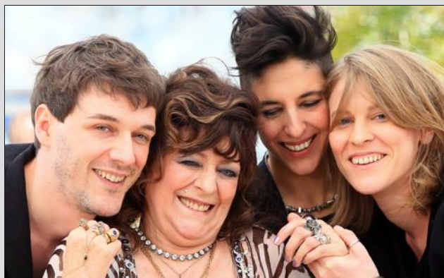
Pour son prochain film, Claire Burger (à droite), réalisatrice de Party Girl, recherche des figurants.

Après Forbach , c'est gratuit pour les filles et Party Girl (caméra d'or au festival de Cannes 2014). Claire Burger, réalisatrice originaire de Forbach, tournera son prochain film, C'est ça l'amour , dans la région à partir du mois d'août.